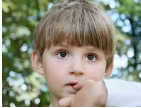
Resim 2.13: 2-3 yaşlarında Tırnak yeme

Tırnak yeme davranışı, tırnağı ya da tırnak etini dişiyile koparma davranışı olarak tanımlanmaktadır. 4-5 yaşlarından itibaren görülmeye başlar. Nadiren daha küçük yaşlarda da görülebilir. Okul çağında tırnak yeme en yoğun şekilde görülür. Tırnak yeme davranışı hem psikolojik hem de bazı sağlık problemlerine (mikropların taşınması) yol açmaktadır.