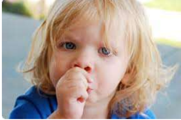
Resim 2.11: Keşfetme güdüsüyle ilk yıllarda parmak emme

Birçok uzman, yeterli ilgi ve sevgi görmeyen, temel ihtiyaçları zamanında karşılanmayan, huzursuz bir aile ortamında büyümüş, güvensiz çocuklarda parmak emme davranışının sıklaştığını belirtir. İlk yıllar için normal kabul edilen bu davranış ileriki yaşlarda devam eder veya yeniden ortaya çıkarsa bir uyumsuzluk sorunu olarak kabul edilir.