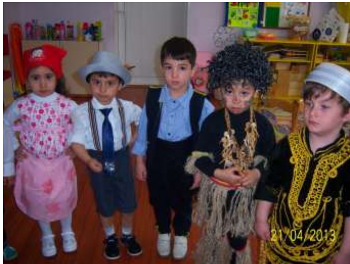
Resim 2.8: Çocuklarda barış hâlinde mutlu yaşamının önemi

Çocuk saldırganlaşıyor diye her isteği yapılmamalıdır. Kesinlikle saldırganlığa saldırganlıkla cevap vermemelidir.