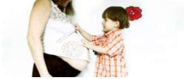
Resim 2.9: Yeni bir kardeş fikri

Yeni bir kardeşin dünyaya gelmesi genellikle kıskançlık başlangıcı olabilir. O güne kadar tüm sevgi ve ilgiyi tek başına yaşarken yeni bir kardeş ona göre sevgiyi parçalamıştır. Yeni doğanın anneye bağımlı oluşu da kıskançlık duygusunu iyice artırır.