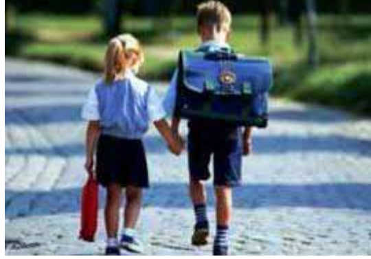
Resim 1.1: Uyumun farklı yaşlara etkisinin önemi