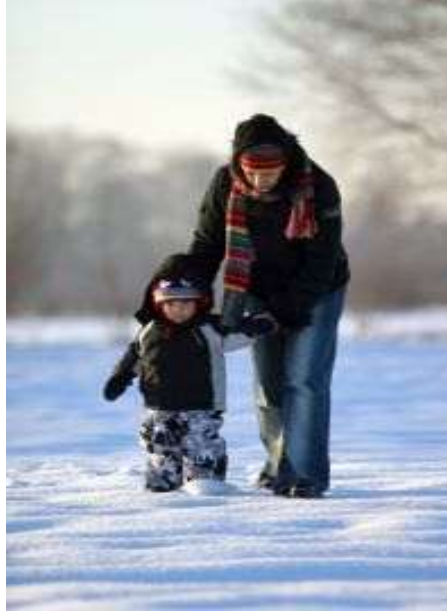
Resim 1.5: Çevreye uyum sağlamada anne desteğinin önemi

Okul ise çocuk için önemli başka bir çevredir. Bireysel farklılıklar, gerekli rehberlik, öğretmenlerin ve yöneticilerin tutumu çocuğun uyum başarısında önemlidir.