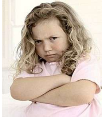
Resim 2.7: Çocuklarda inat

Öncelikli olarak çocuğun yaş ve gelişim özelliklerine uygun inatçılık eğilimleri normal karşılanmalıdır. Kabul edilmesi gereken çok önemli noktalardan biri, çocuğun aile büyüğünden farklı duyup, farklı görüp, farklı algılayıp, farklı düşündüğüdür. Bu yüzden çocuğun yetişkinlerden farklı olan düşüncelerine saygı göstermeli gereksiz inat davranışları göstererek çocuğa yanlış model olunmamalıdır.