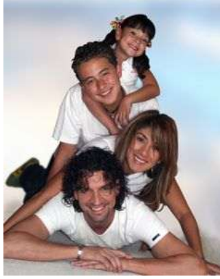
Resim 2.15: Problemlerin çözümünde aile içi sevgi ve dayanışma