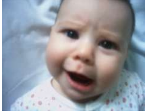
Resim 2.5: Bebeklerin öfkesi ve ağlama

Öfke, çocuğun isteklerinin engellenmesi veya anlaşılmadığını düşünmesi sonucu ortaya çıkan olumsuz tepkilerdir. Bebeklik çağında beslenme, temizlik, uyku gibi temel ihtiyaçlarının zamanında karşılanmaması bebekte ağlama çırpınma gibi öfke belirtilerine sebep olur.