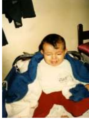
Resim 2.2: Bebeğin korktuğunda ağlama tepkisi