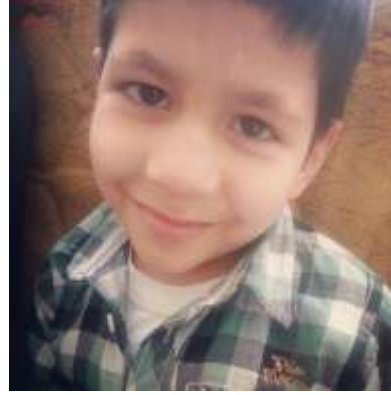
Resim 2.6: Çocuklarda farklı duygular