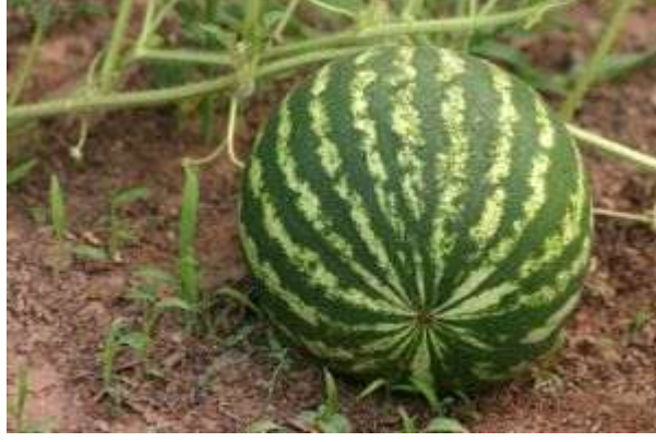
Resim 2.3: Canavar karpuz bahçede

kurtulduğuna seviniyormuş ama bu kez de bir canavarı bile yiyen, gaddar ve zalim yabancidan daha fazla korkmaya başlamış.