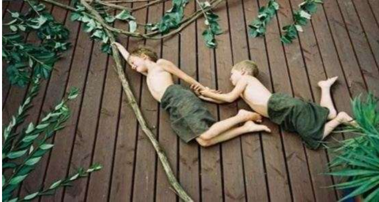
Resim 2.14:Hayali oyunlar

Altı yaşından küçük çocuklar, gerçeğe hayali birbirinden ayırt edemedikleri için bu yaşa kadar söylenen yalanlar davranış bozukluğu olarak düşünülmez. Evde yalnız başına evcilik oynarken boş koltuklarda misafir varmış gibi onlarla konuşan, “Kiminle oynuyorsun” sorusuna “Arkadaşlarım var bak onlarla oynuyorum” diyen dört yaşındaki bir çocuk hayali oyunlar oynar ve hayali yalanlar söyler. Bu, onun gelişimsel özelliğidir. Okul öncesi dönemde henüz hayal ve gerçeği birbirinden ayıracak olgunluğa ulaşmadıkları için çocuğun her söylediği yalan olarak değerlendirilmemelidir.