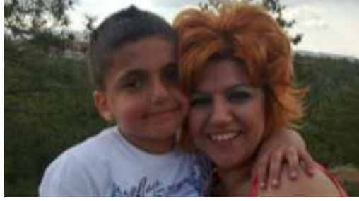
Resim 2.1: Her problemin çözümünde sevginin önemi

okula gitmekten çekinme ve tek başına uyumakta güçlük çekme gibi davranışlar sergileyebilir.