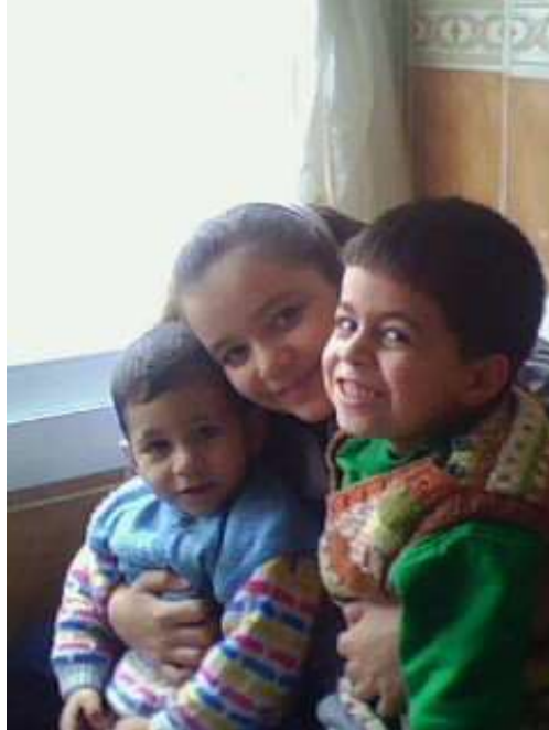
Resim 2.10: Çocuklarda kardeşliğin önemi

Kardeşini kıskanan çocukta, mızımızlanma, bebek gibi konuşma, meme emmek isteme, altını ıslatma gibi gerileme davranışları görülebilir. Yine çocuk sürekli “Uykum geldi.”, “Karnım acıktı.”, “Çişim var.” gibi sözlerle anne-babayı rahatsız edip ilgiyi kendine çekmeye çalışır. Devamlı olarak huzursuzluk duyar ve çevresindekileri de huzursuz eder. Basit nedenlerle öfkelenir, eşyalarına zarar verir, nedensiz ağlar. Anne- babanın kardeşler arasında karşılaştırmalar yapması da kıskançlığı pekiştirir. “ Kardeşin senden küçük olduğu hâlde her şeyi senden daha iyi yapıyor.”, “Kardeşine bir kere söyleyince hemen anlıyor, sana defalarca söyledim hâlâ anlamıyorsun.” gibi sözler çocuğun kardeşine karşı olan kızgınlığını ve öfkesini artırır. Çevredeki kişilerin de bilinçsizce yeni kardeşi olan çocuğa, “senin pabucun dama atıldı.”, “Bak o küçük artık onu seveceğiz.” gibi sözleri kıskançlık duygusunu besler.