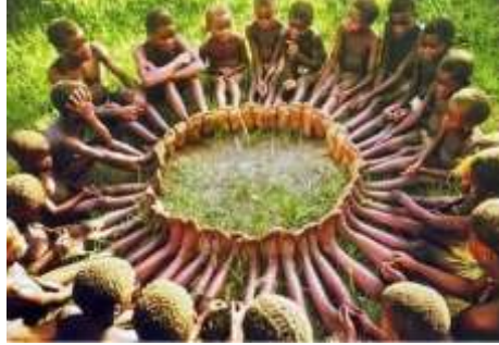
Resim 1.3: Bir gruba dâhil olmanın psiko-sosyal ihtiyaçlarımıza etkisi

Bireyin büyüüp gelişebilmesi için zamanında ve yeterli karşılanması zorunlu ihtiyaçlardır. Solunum, yemek yeme, boşaltım, barınma, sıcak ve soğuktan korunma, vb. Bu ihtiyaçların zamanında ve yeterli karşılanması çocukta güven duygusunu geliştirir. Beslenme saati gecikmiş, uykusunu alamamış çocuk huzursuz, öfkeli ve saldırgan olur.