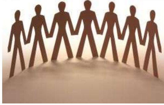
Resim 1.2: İçinde yaşadığımız topluma uyumun etkisi

Bazen de uyumsuz davranış olarak açıklanmayacak bir davranış çevrenin olumsuz yaklaşımı sonucu uyumsuz davranış olarak yerleşebilir. Örneğin; ergenlik çağındaki bir gencin kendini kanıtlamak, var olduğunu göstermek için yaptığı çabalarla alay edilmesi uyum problemlerine neden olabilmektedir.